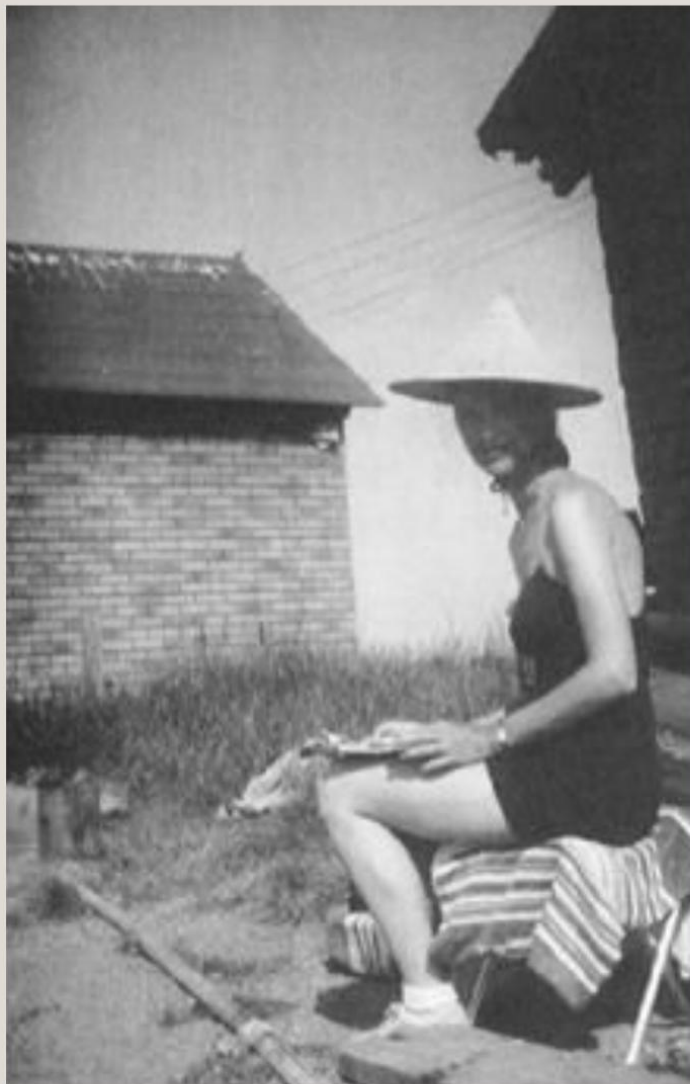
Sylvia Plath drawing in Wisconsin, 1959